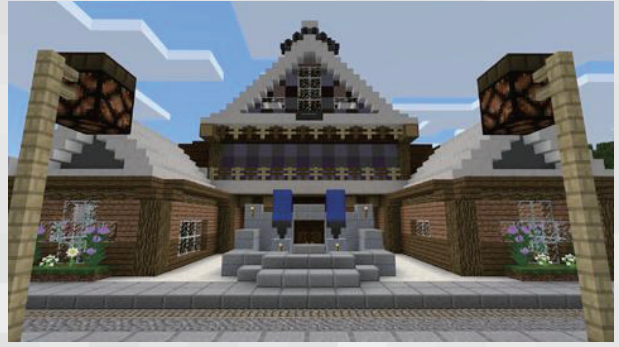
自由创造和练习指导